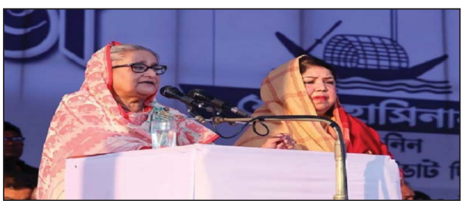
রংপুরের পীরগঞ্জ সরকারি উচ্চ বিদ্যালয় মাঠে বিশাল নির্বাচনী জনসভায় প্রধান অতিথির ভাষণ দেন আওয়ামী লীগ সভাপতি ও প্রধানমন্ত্রী শেখ হাসিনা।

পরিস্থিতিতে পড়ে যান ইসরায়েলি প্রধানমন্ত্রী। তিনি বলেন, বন্দিদের মুক্ত করার ব্যাপারে হস্তক্ষেপ করা জন্য তিনি চীনা প্রেসিডেন্ট শি জিনপিং ও রাশিয়ার প্রেসিডেন্ট ভ্লাদিমির পুতিনকে শক্ত করে ধরেছেন। এমনকি তার স্ত্রী সারা গাজা থেকে ইসরায়েলি বন্দিদের মুক্ত করে আনতে সাহায্য করার জন্য পোপ ফ্রান্সিসকে সবিনয় অনুরোধ জানিয়েছেন। ইসরায়েলের অভ্যন্তরে পদত্যাগের জন্য প্রচণ্ড চাপের মুখে থাকা নেতানিয়াহু আরো বলেন, আমরা বিজয় অর্জন না করা পর্যন্ত যুদ্ধ থামাচ্ছি না কারণ, আমাদের আর কোনও ভূমি বা অন্য কোনও পথ নেই।