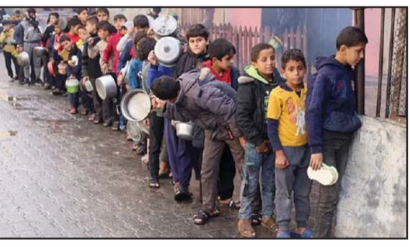
ত্রাণের খাবারের জন্য সারিবদ্ধ হয়ে দাঁড়িয়েছে গাজার শিশু-কিশোরীরা

ইতিহাস সম্পর্কে অজ্ঞ উল্লেখ করে আবু উবায়দা বলেন, দখলদার বাহিনী ফিলিস্তিনীদের নির্মূল করে হীন চেষ্টা চালিয়েছে, তা ব্যর্থতায় পর্ববসিত হয়েছে। তারা ইতিহাস থেকে শিক্ষা নেয়নি। তারা আমাদের চিনতে ভুল করেছে। আবু উবায়দা আরও বলেন, আল কাসামের যোদ্ধারা জায়নবাদী অনুপ্রবেশের সকল পথে পূর্ণ প্রস্তুতিসহ অবস্থান করছে। শত্রুদের কোনো পথ খোলা নেই।