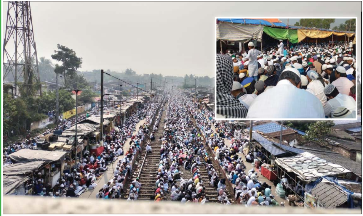
দক্ষিণ ২৪ পরগনার মগরাহাটে তবলিগি জামাতের তিন দিনের ইজতেমার সোমবার ছিল আখেরি মুন্সাজাত। আখেরি মুন্সাজাতে কয়েক লক্ষ মানুষ অংশ নেন। মগরাহাটের ওলি মার্জাজ ময়দানে স্থান সঙ্কুলান না হওয়ায় ভিড় ছাপিয়ে মগরাহাট স্টেশন জনারণ্য।