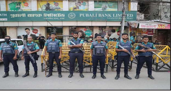
রাজধানীর নয়াপল্টনে বিএনপির কেন্দ্রীয় কার্যালয়ের মূল ফটকে ১৫ দিন ধরে তাল্লা বুলছে। কার্যালয়ের সামনে অবস্থান করছে পুলিশ। রোববার বিএনপির কেন্দ্রীয় কার্যালয় এলাকায় এমন চিত্র দেখা গেছে।